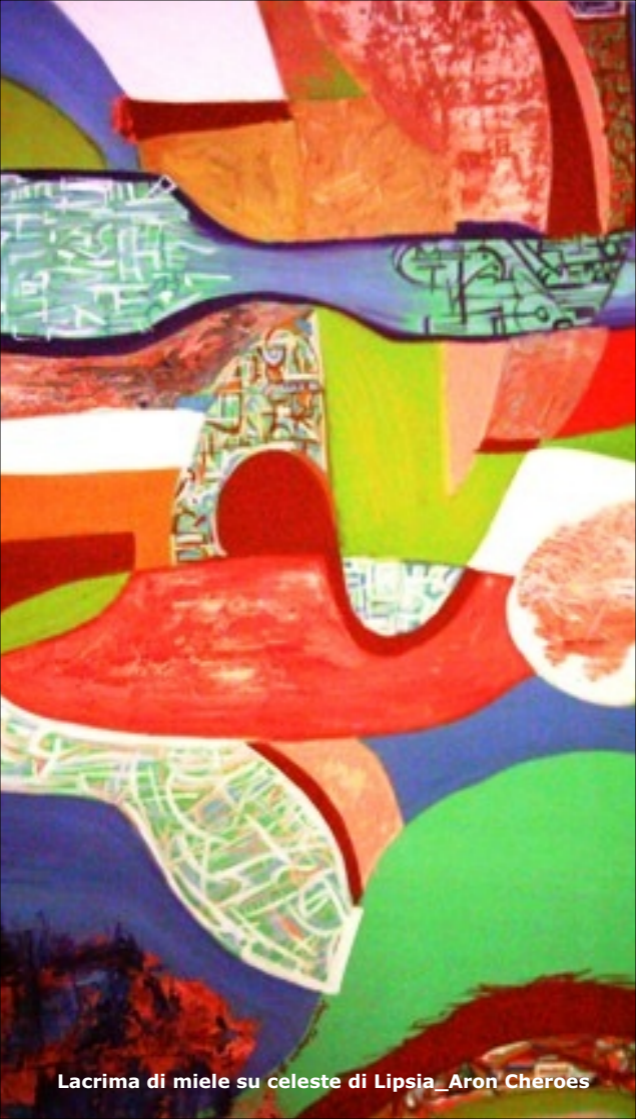
Lacrima di miele su celeste di Lipsia_Aron Cheroes