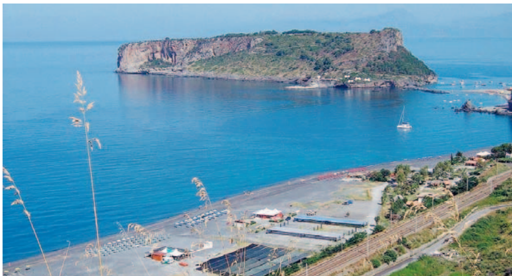
La splendida spiaggia e sullo sfondo l'isola di Dino: un patrimonio da rilanciare