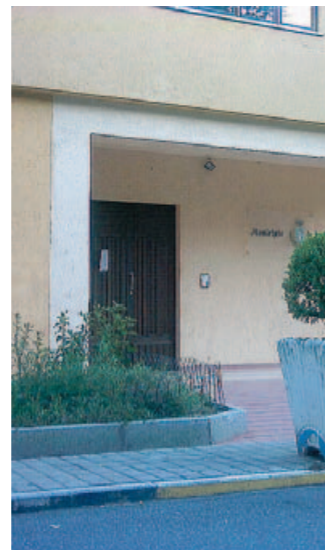
L'ingresso a Palazzo di città

po dello Stato a «dar luogo allo scioglimento della rappresentanza consiliare». Il decreto di scioglimento, firmato da Napolitano il 31 gennaio è stato pubblicato nella Gazzetta ufficiale n. 39 di giovedì 17 febbraio. Questa la testuale proposta di Maroni fatta al Presidente della Repubblica: «Nel consiglio comunale di Sant'Agata d'Esaro - scrive il ministro - rinnovato nelle consultazioni elettorali del 6 e 7 giugno 2009 e composto dal sindaco e da dodici consiglieri, si è venuta a determinare una grave situazione di crisi a causa delle dimissioni rassegnate da otto componenti del corpo consiliare. Le dimissioni, presentate personalmente da oltre la metà dei consiglieri con atto unico acquisito al protocollo dell'en-