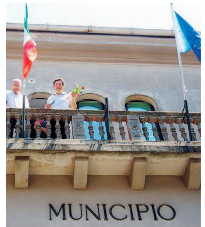
Palazzo Santa Chiara, sede del Municipio

cato sui finanziamenti richiesti per la realizzazione d'un calzaturificio che sarebbe dovuto sorgere nella zona industriale di San Marco. Un opificio industriale per il quale la proprietà chiese un finanziamento comunitario da un milione di euro. Tuttavia, da accertamenti sviluppati dagli specialisti del Nucleo di Polizia tributaria della guardia di finanza emersero ipotetiche irregolarità. I rilievi delle Fiamme gialle riguardavano prevalentemente i macchinari acquistati per l'attività calzaturiera da avviare. Apparecchiature di seconda mano e di valore inferiore a quello descritto nel progetto. Inoltre, sarebbero state accertate, pure, presunte sovrappuntazioni. E così, nel gennaio del 2007, gli investigatori della Guardia di finanza si presentarono nel calzaturificio per eseguire un'ordinanza applicativa di misure cautelari ed eseguirono, pure, il sequestro per equivalente di un capannone e di macchinari destinati all'attività. Nel corso delle indagini, i finanziamenti avrebbero dovuto sequestrare anche un secondo capannone che, tuttavia, risultò venduto ad una società di Roma. All'esito di accertamenti, sarebbe emerso che della società avrebbero materialmente fatto parte la Ferretti e una parente di Trotta. ◀