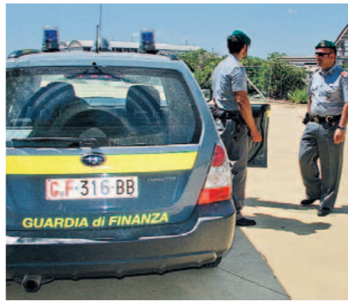
La guardia di finanza ha scoperto l'ipotetico raggio

cato sui finanziamenti richiesti per la realizzazione d'un calzaturificio che sarebbe dovuto sorgere nella zona industriale di San Marco. Un opificio industriale per il quale la proprietà chiese un finanziamento comunitario da un milione di euro. Tuttavia, da accertamenti sviluppati dagli specialisti del Nucleo di Polizia tributaria della guardia di finanza emersero ipotetiche irregolarità. I rilievi delle Fiamme gialle riguardavano prevalentemente i macchinari acquistati per l'attività calzaturiera da avviare. Apparecchiature di seconda mano e di valore inferiore a quello descritto nel progetto. Inoltre, sarebbero state accertate, pure, presunte sovrappuntazioni. E così, nel gennaio del 2007, gli investigatori della Guardia di finanza si presentarono nel calzaturificio per eseguire un'ordinanza applicativa di misure cautelari ed eseguirono, pure, il sequestro per equivalente di un capannone e di macchinari destinati all'attività. Nel corso delle indagini, i finanziamenti avrebbero dovuto sequestrare anche un secondo capannone che, tuttavia, risultò venduto ad una società di Roma. All'esito di accertamenti, sarebbe emerso che della società avrebbero materialmente fatto parte la Ferretti e una parente di Trotta. ◀