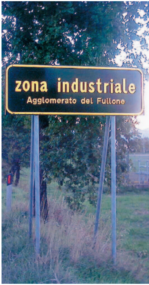
La porta d'accesso all'area industriale del "Fullone"

Il teorema accusatorio del pm Giuseppe Cozzolino è stato im-